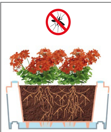
RISERVA D'ACQUA ANTI-ZANZARE ANTI-MOSQUITOS SELF WATERER